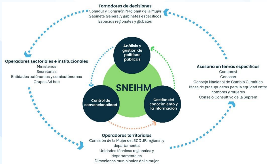
Figura 1. Esquema del SNEIHM

El SNEIHM, con el desarrollo e implementación de herramientas técnicas y metodológicas, constituye la forma de coordinar, orientar y asesorar la gestión interinstitucional con el SNP, en términos de control de convencionalidad, políticas públicas, gestión sectorial, gestión territorial y gestión del conocimiento y la información, para orientar la toma de decisiones, respecto de la oferta programática y el presupuesto.