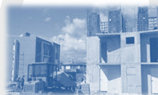
Construcción de viviendas