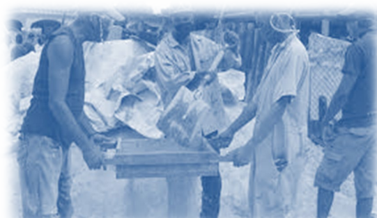
Transformación de Barrios y comunidades, con la participación del pueblo.