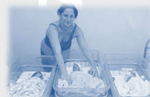
Madres con más de 3 hijos