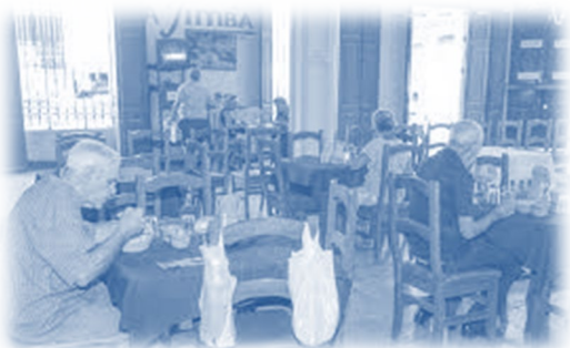
Situaciones de vulnerabilidad

Da cobertura financiera al sostenimiento de los servicios y programas sociales: