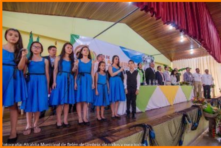
Fotografía: Alcaldía Municipal de Belén de Umbria, de todos y para todos.