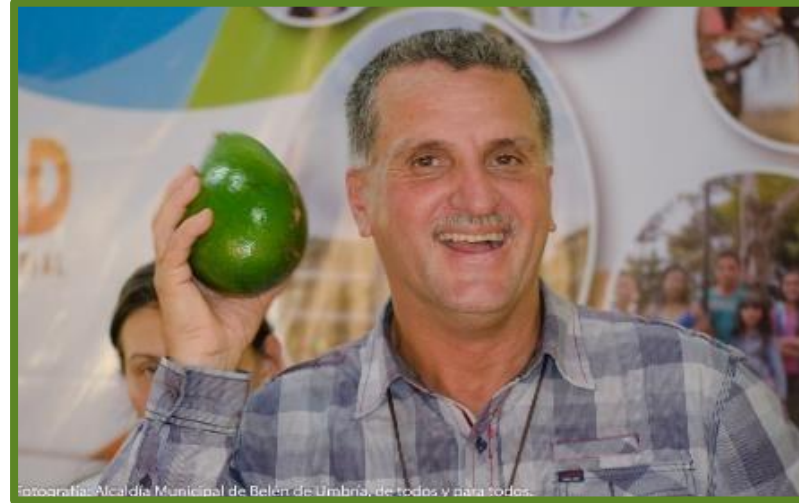
Fotografía: Alcaldía Municipal de Belén de Umbria, de todos y para todos.