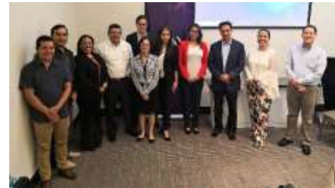
Panamá 20-21 septiembre

Este proyecto además elaborará un portal para compartir información migratoria entre las instituciones, a la vez que brindará capacitaciones en diversos países.