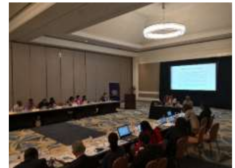
Jamaica 24-25 septiembre