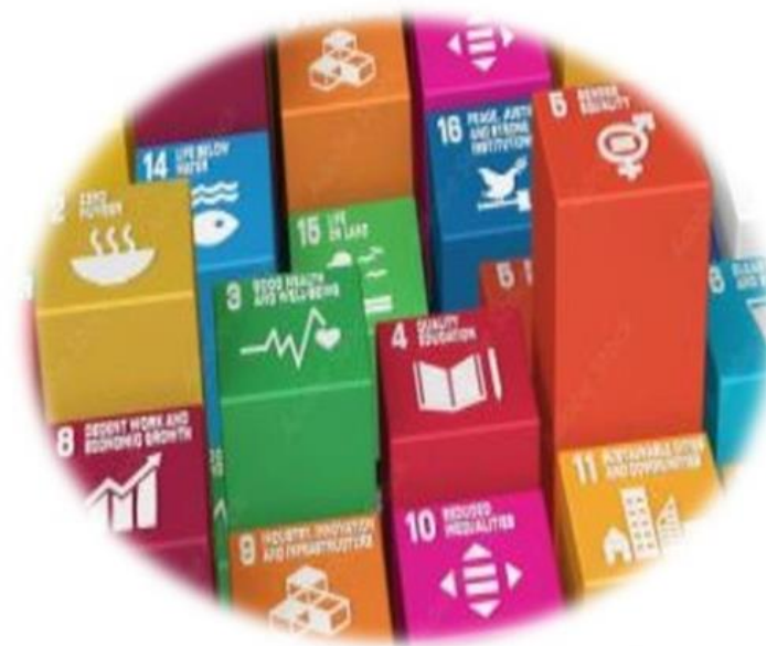
Grupo de Coordinación Estadística para la Agenda 2030 en América Latina y el Caribe

Censuses of Housing and Population: general aspects