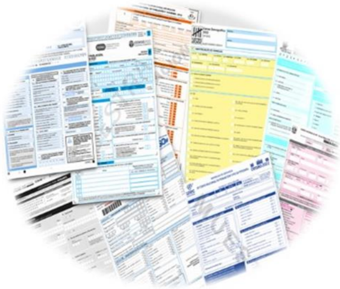
Censos de Población y Vivienda: aspectos generales

Censuses of Housing and Population: general aspects