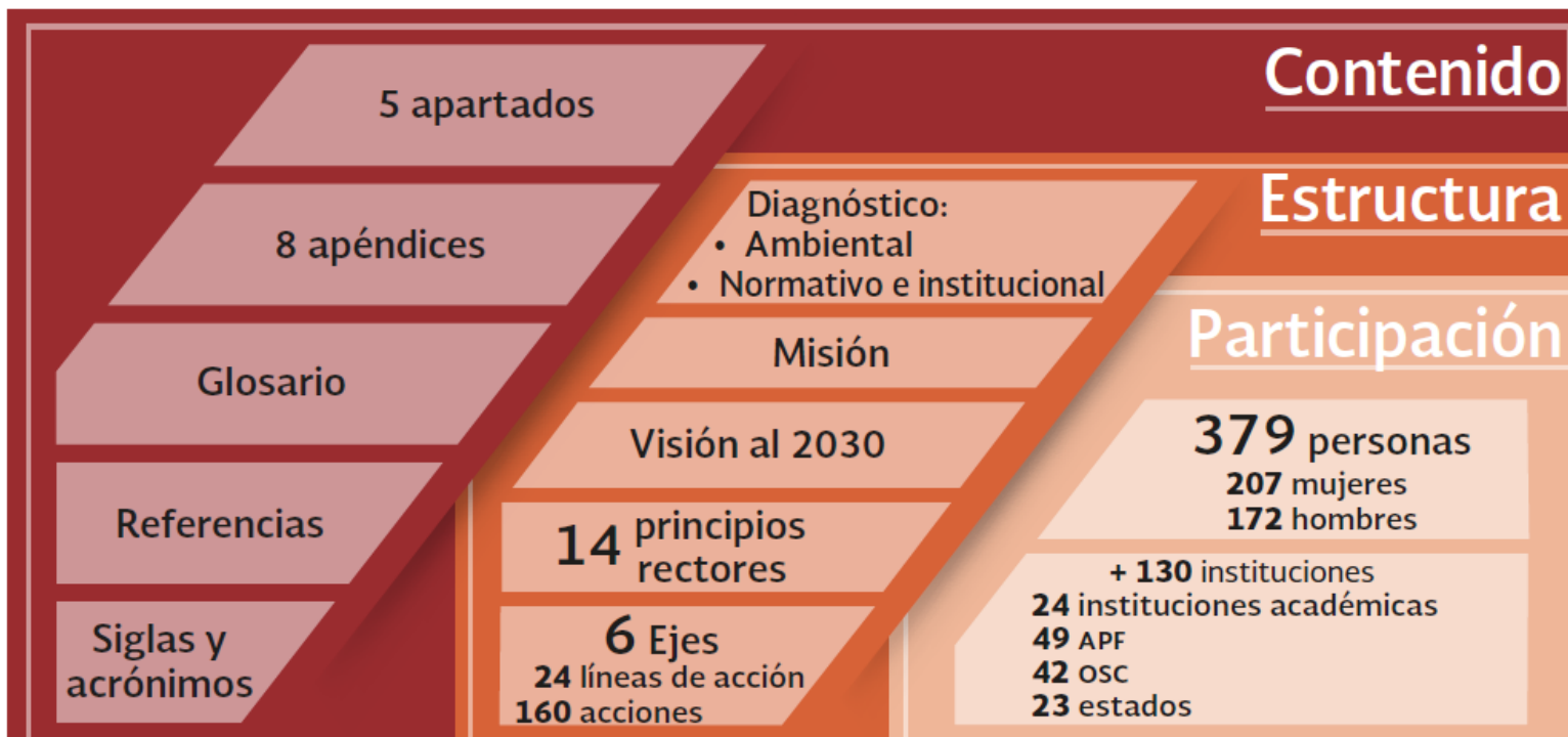
Figura 3. Síntesis del contenido de la ENBioMEX.