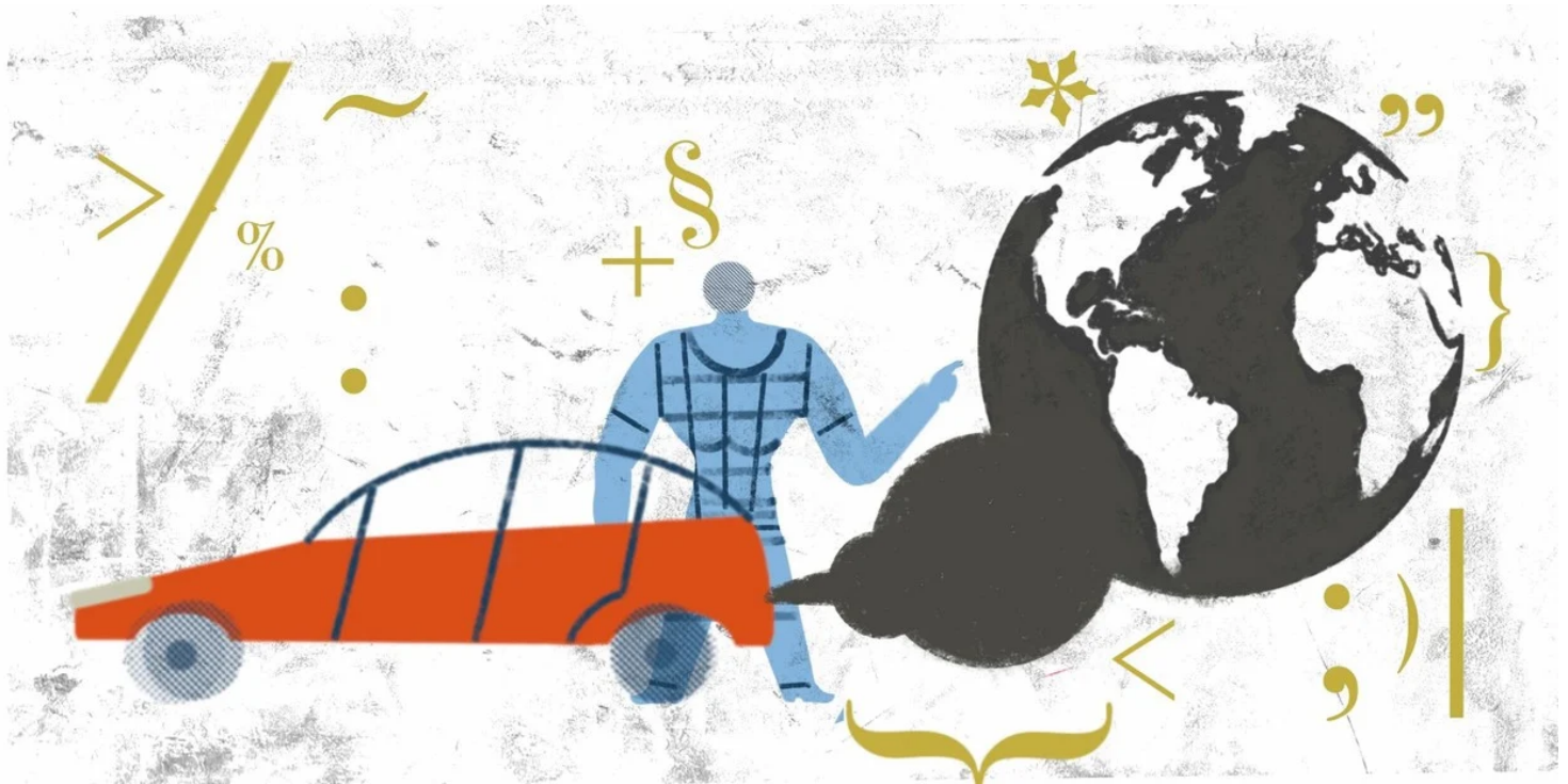
Ilustración: Daniel Roldán